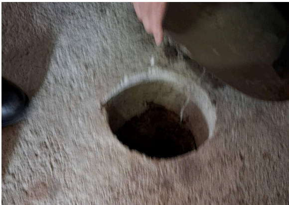
All'esterno della casa, il foro nella concimaia, attraverso cui respiravano i tre uomini, nel secondo nascondiglio.